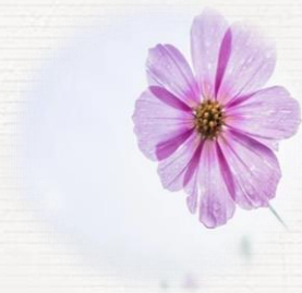
Μαρία Σημαντηράκη ΠΕ04.02